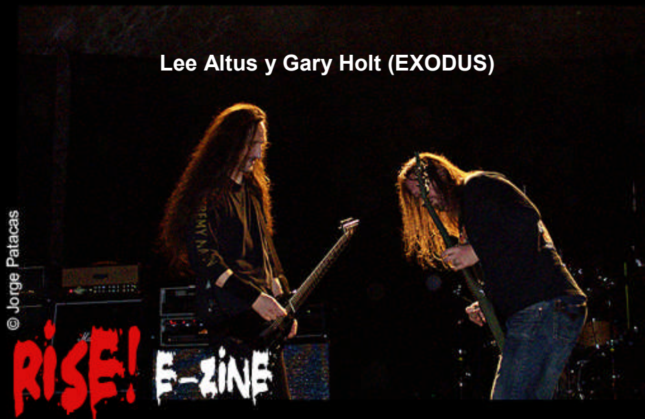
Lee Altus y Gary Holt (EXODUS)