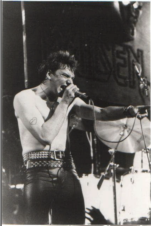
Paul Di'Anno a principios de los '80 en sus épocas como vocalista de Iron Maiden.