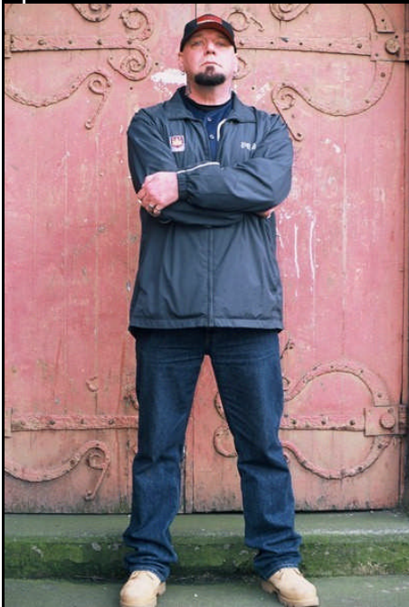
Paul Di'Anno en una sesión de fotos promocionales. Año 2003.