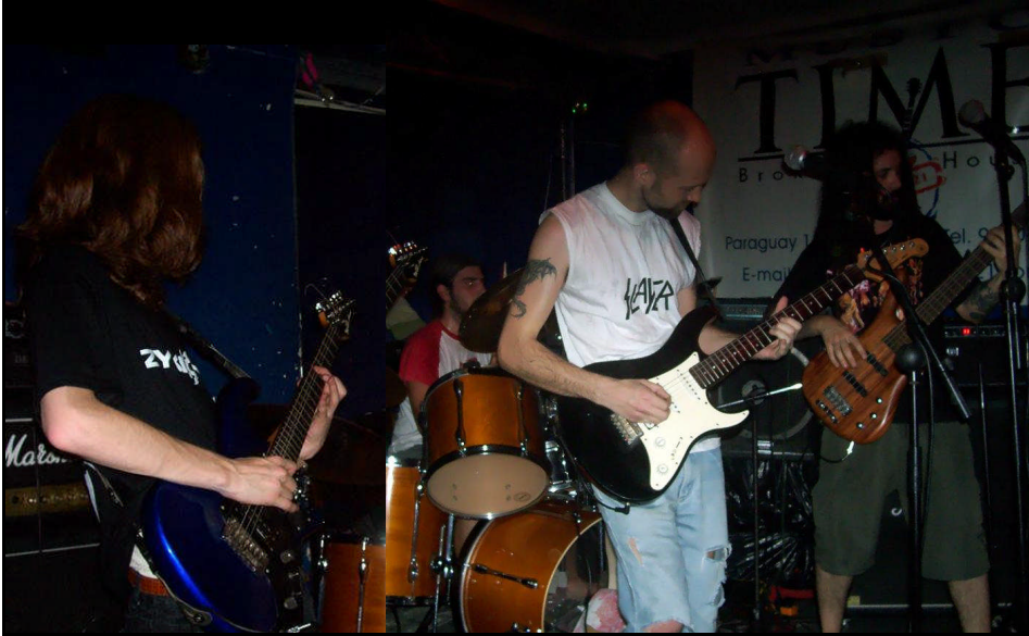
DAWN OF DEFIANCE